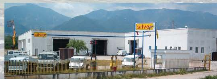
Silver Plus - Frosinone - Italy