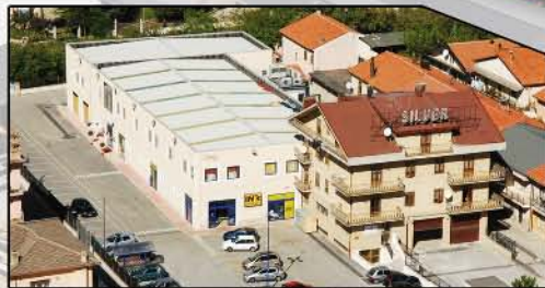
Silver Commercial Park-Capistrello-Italy