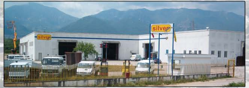
Silver Plus - Frosinone - Italy