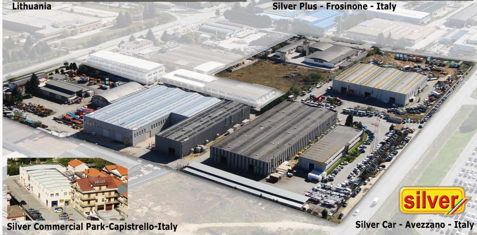
Silver Commercial Park-Capistrello-Italy